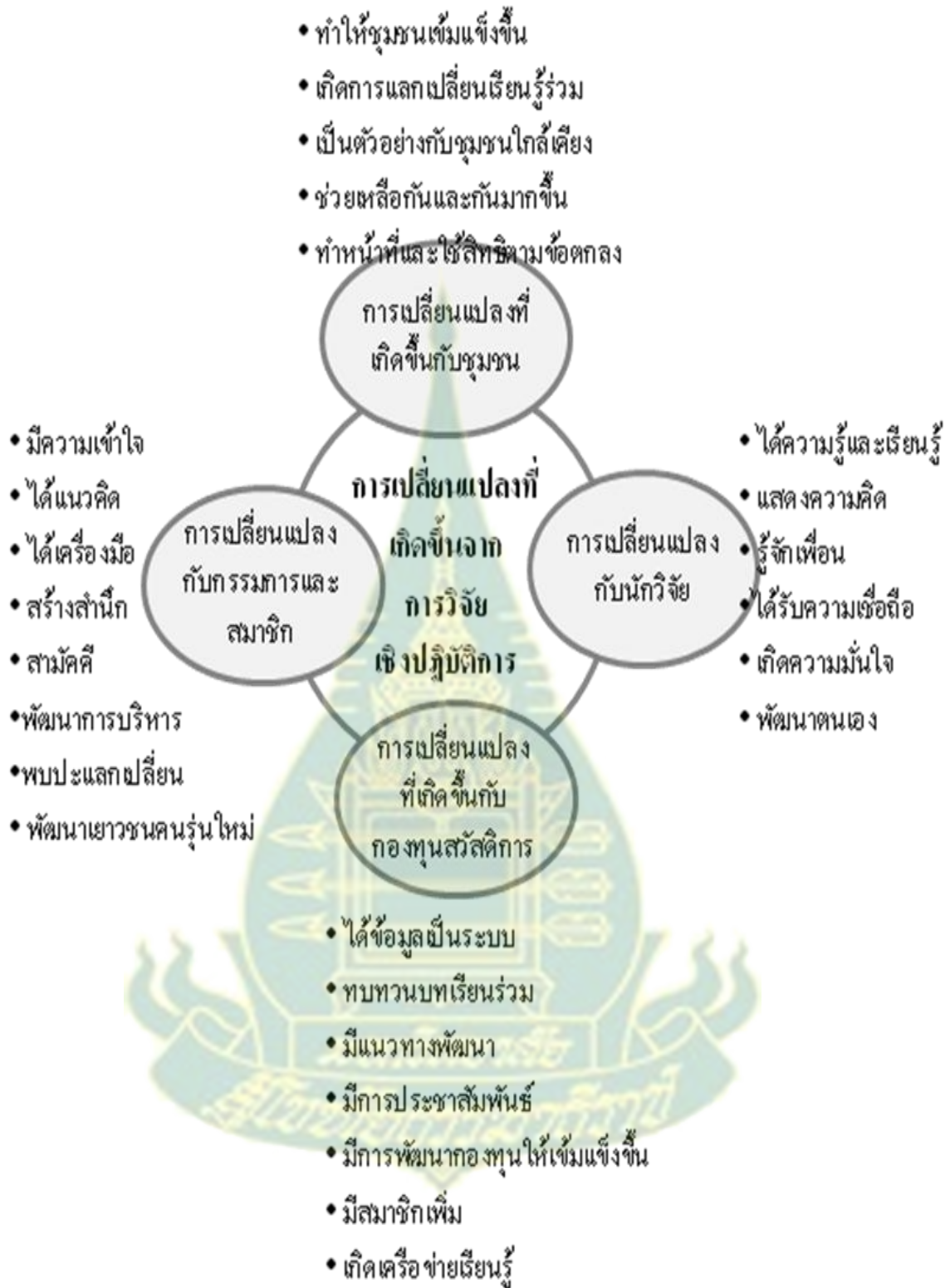
ภาพที่ 7.1 สรุปการเปลี่ยนแปลงที่เกิดขึ้นจากการทำวิจัยเชิงปฏิบัติการแบบมีส่วนร่วม